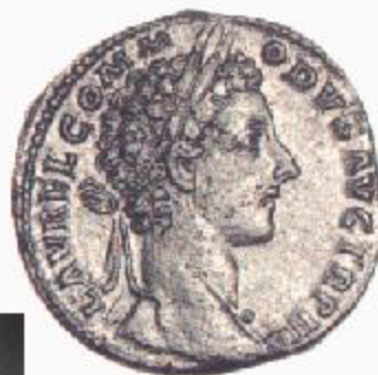
Sesterzio romano di Commodo e l'imperatore del film