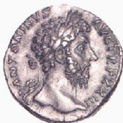
Il Marco Aurelio del film e quello raffigurato in un sesterzio

Le monete di Marco Aurelio e di Commodo si trovarono in mezzo a due riforme monetarie, fatte rispettivamente da Nerone (63 d.C.) e da Caracalla (215 d.C.).