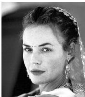
Lucilla in un sesterzio di Roma e la foto dell'attrice del film

Gli imperatori hanno emesso moneta non solo con il proprio nome ma anche con quello di moglie o di altri parenti. Durante l'alto impero queste emissioni avevano la funzione di celebrare e onorare il parente dell'imperatore.