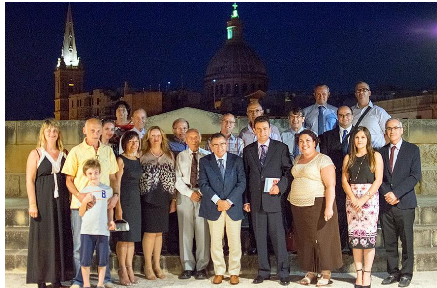
Foto di gruppo a Malta durante la presentazione del libro organizzata a luglio