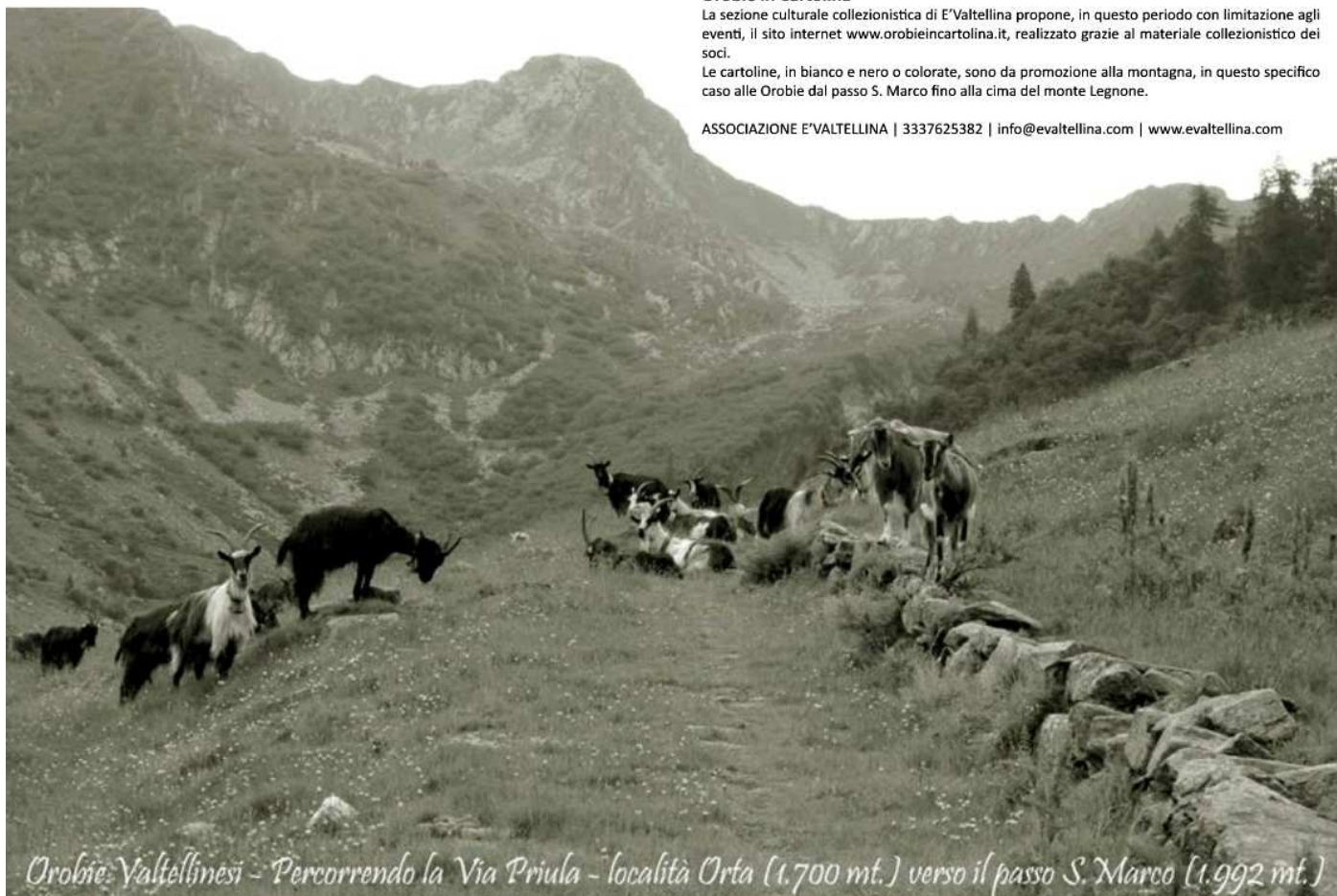
Orobie Valtellinesi - Percorrendo la Via Priula - località Orta (1.700 mt.) verso il passo S. Marco (1.992 mt.)

ASSOCIAZIONE E'VALTELLINA | 3337625382 | info@evaltellina.com | www.evaltellina.com